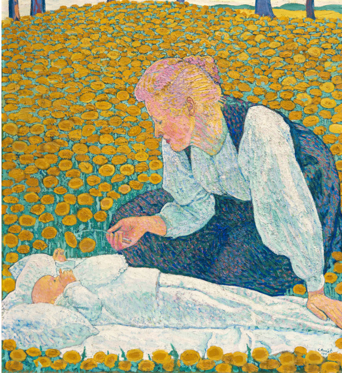
▲ CUNO AMIET Mutter und Kind auf blumenübersäter Wiese. 1906

Öl auf Leinwand. 99,5 × 91,5 cm Müller/Radlach 1906.07