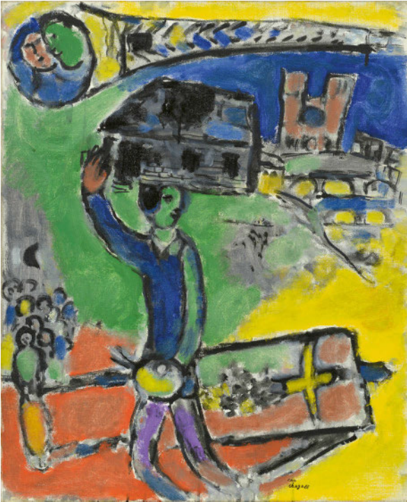
▲ MARC CHAGALL La maison du peintre. 1968 Öl auf Leinwand. 61 × 49,7 cm Echtheitsbestätigung Comité Marc Chagall, Paris