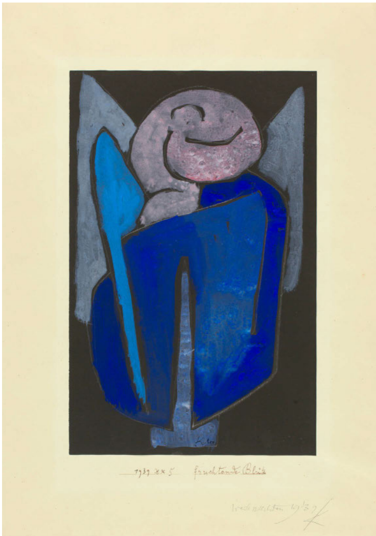
▲ PAUL KLEE Fruchtende Blüte. 1939

Tempera und Aquarell auf schwarz grundiertem Papier. 45,7×33 cm, Unterlage Catalogue raisonné 8611